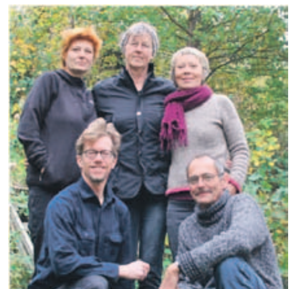
Rødderne udstiller i efterårsferien.